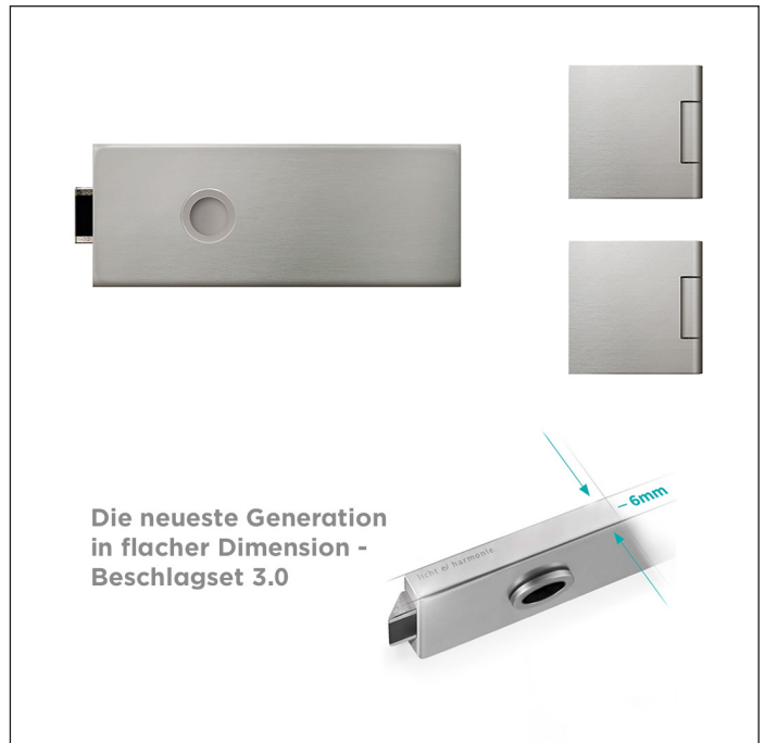
Bildkomposition2 - Beschlagset 3.0 Beschlagset Square ähnl. Edelstahl matt