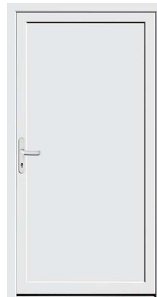
Nebeneingang Protect 04