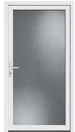
Nebeneingang Protect 03