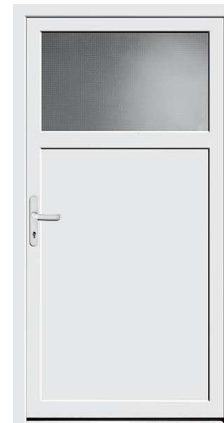
Nebeneingang Protect 02