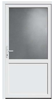
Nebeneingang Protect 01