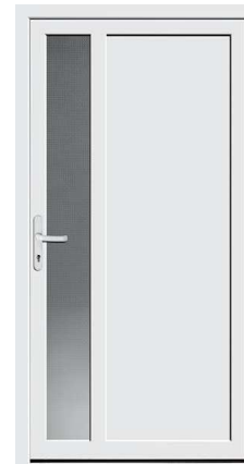
Nebeneingang Protect 05