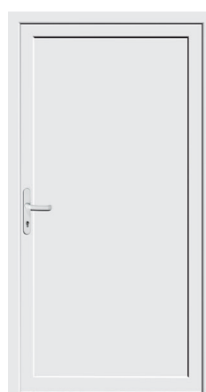
Nebeneingang Protect 04