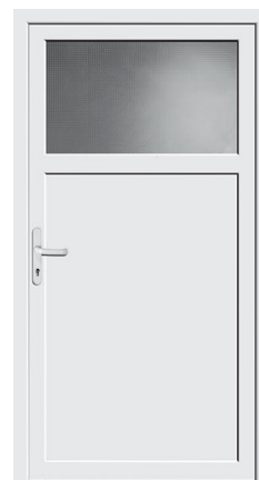
Nebeneingang Protect 02