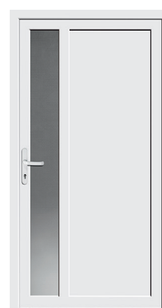
Nebeneingang Protect 05