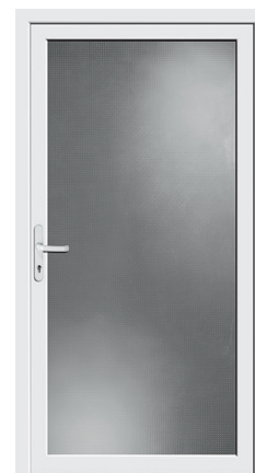
Nebeneingang Protect 03