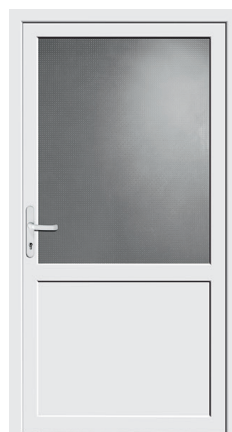
Nebeneingang Protect 01